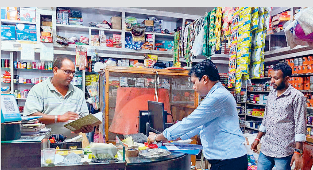
मानते हुए उसके विरुद्ध वैधानिक दीपावली त्यौहार के चलते खाद्य एवं शहर तथा भोपालपटनम क्षेत्र के कार्यवाही की जाएगी। आगामी औषधि प्रशासन की टीम द्वारा बीजापुर किराना दुकानों तथा मिटाई दुकानों में