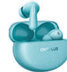
OnePlus Buds 3 Pro