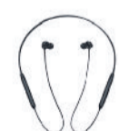
OnePlus Neckband ANC

OnePlus Experience Stores (JBK ELECTRONICS)